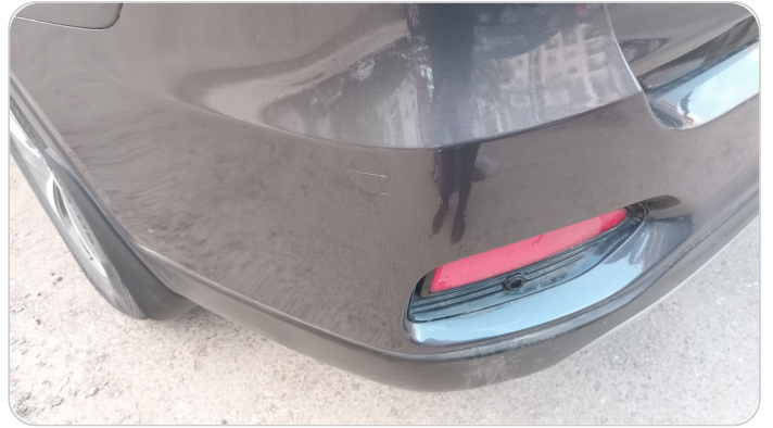
الاكصدام الخلفي : رش بدون معجون (خرابيش)