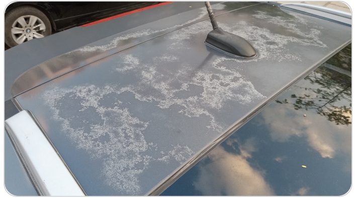
السقف : فبريكة ( الدهان متاكل )