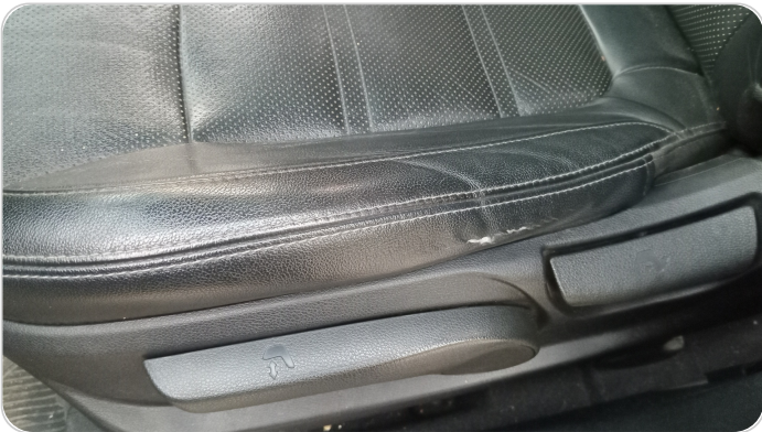
فرش كرسي أمامي شمال : قطع /كسر / شرح /تلف