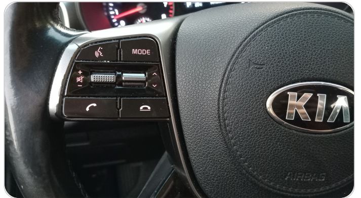
وحده تحكم الصوت من الطاره : قطع /كسر / شرح /تلف