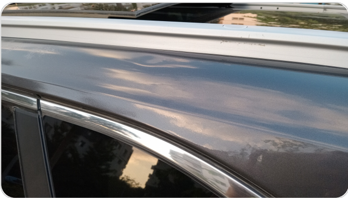
قائم خارجي خلفي شمال : رش بدون معجون (خبطات)