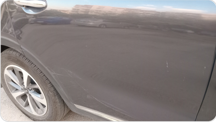
الباب الخلفي يمين : رش بدون معجون (خبطات)