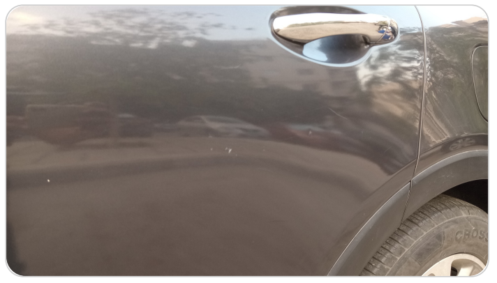
الباب الخلفي شمال : رش مع معجون (خرابيش)