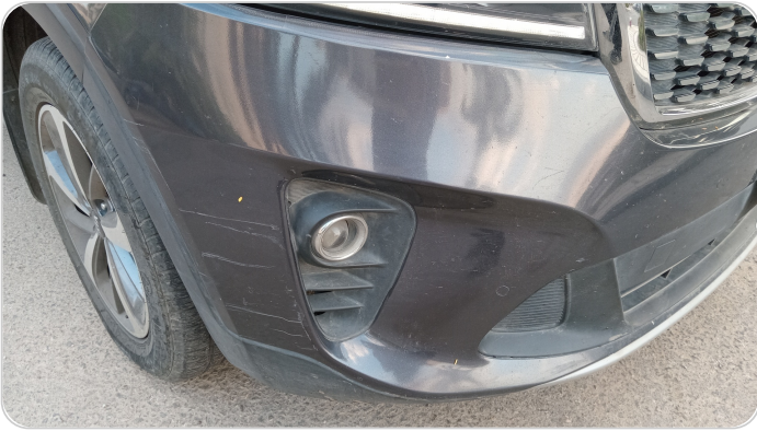
الاكصدام الأمامي : رش بدون معجون (خرابيش)