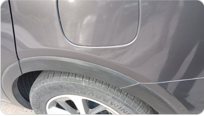
الرفرف الخلفي شمال : رش مع معجون (خرابيش)