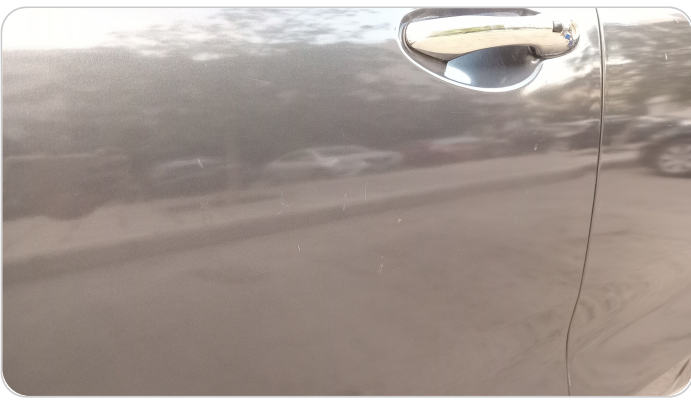
الباب الأمامي شمال : رش مع معجون (خرابيش)