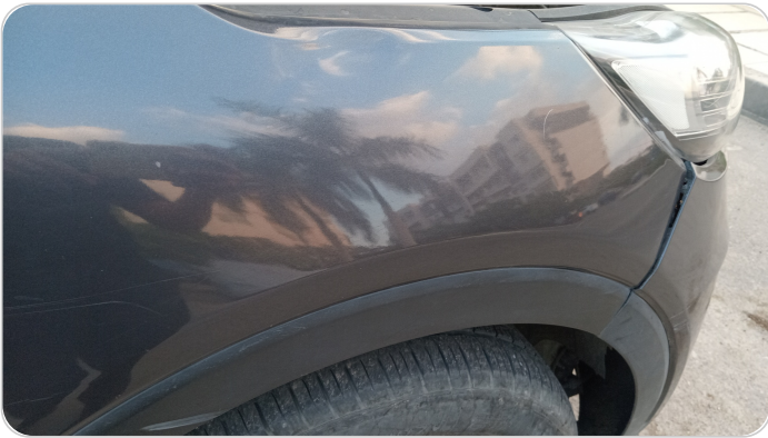
الرفرف الأمامي يمين : رش بدون معجون (خبطات)