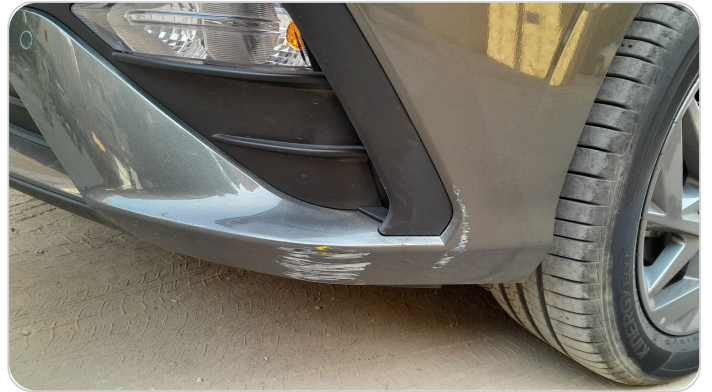
الاكصدام الأمامي : فبريكة (خرايبش)