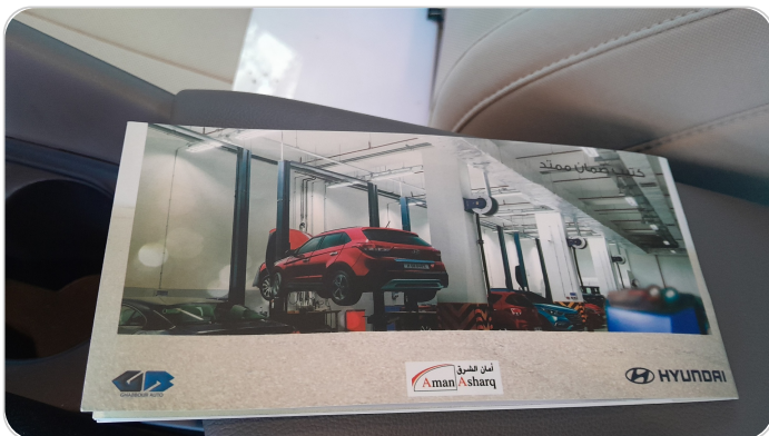
كتيب الضمان : موجود