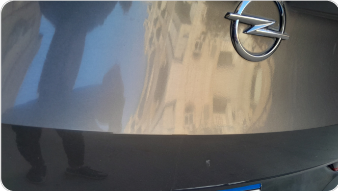
باب الشنطة : فبريكة (خرايش)