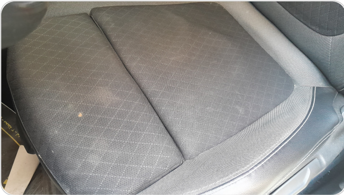
فرش كرسي أمامي شمال : قطع / كسر / شرخ / تلف