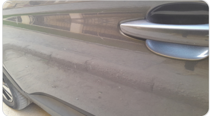
الباب الأمامي شمال : فبريكة (خرايش)