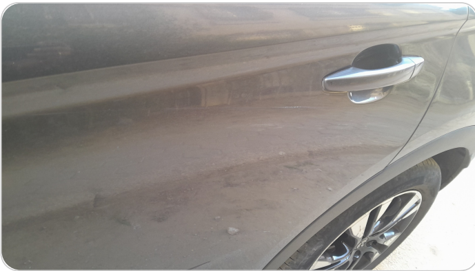
الباب الخلفي شمال : فبريكة (خرايش)