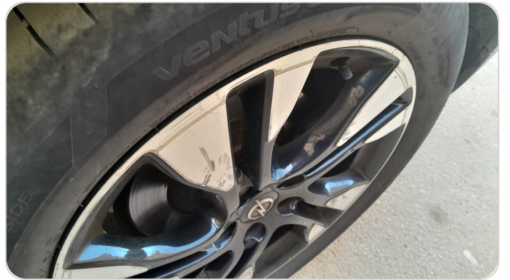
حالة الجنوط الخلفي : تجريحات بسيطه