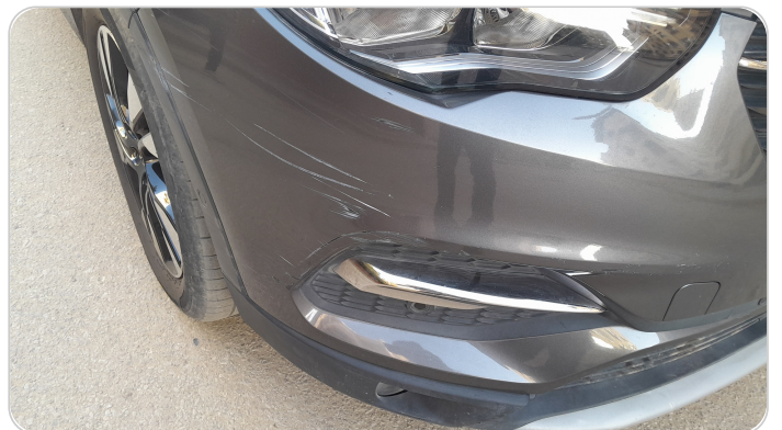
الكصدام الأمامي : فبريكة (خرايش)