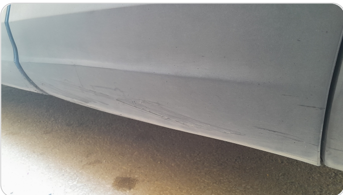
العتب السفلي شمال : فبريكة (خرايش)