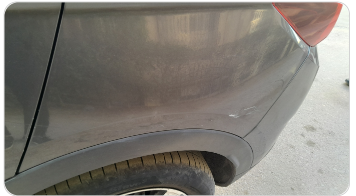
الرفرف الخلفي شمال : فبريكة (خرايش)