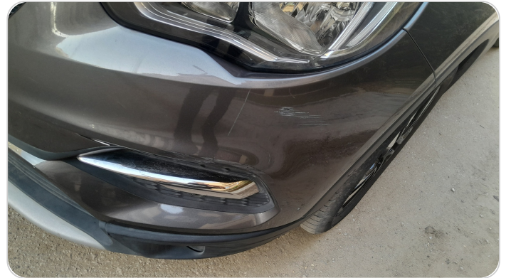
الاكصدام الامامي : فبريكة (خرابيش)