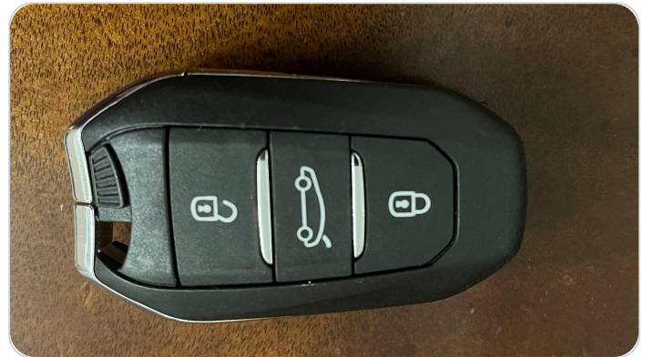
الريموت /المفتاح الاضافي : موجود (لم يتم التجربة)