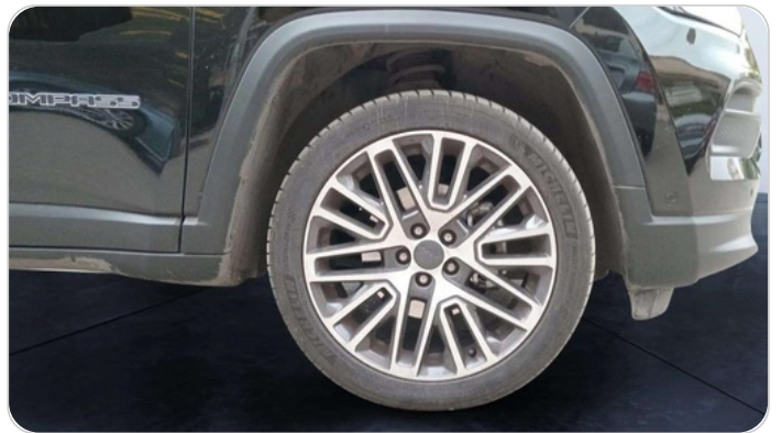
FR R TIRE