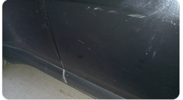
الباب الأمامي يمين : فبريكة (خرابيش)