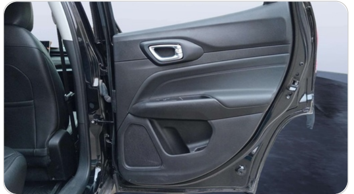
RR R DOOR