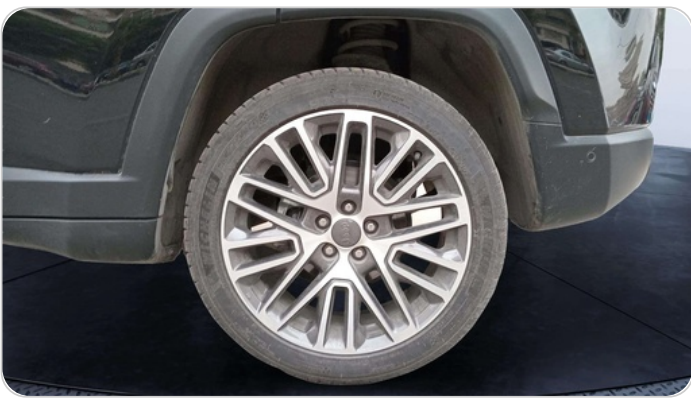
RR L TIRE