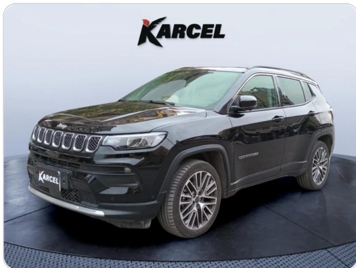
FR L 45