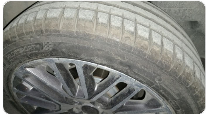
حالة الكاوتش الخلفي : تشققات/قطع بسيط