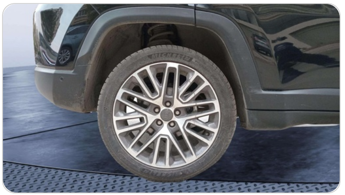
RR R TIRE