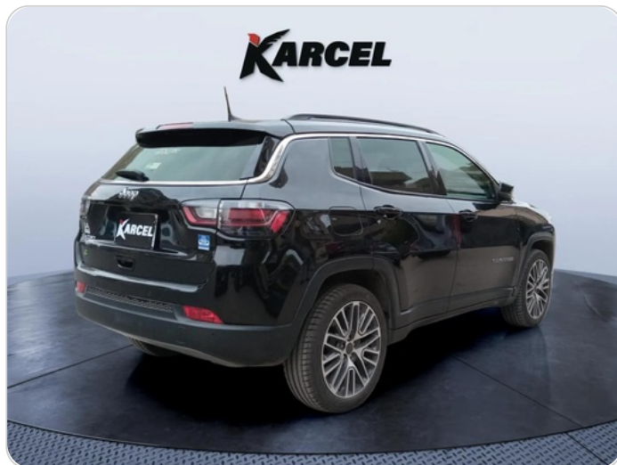
RR R 45