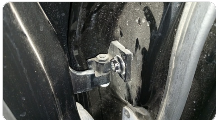
مفصلات ومسامير الباب الخلفي يمين : آثار فك وتركيب