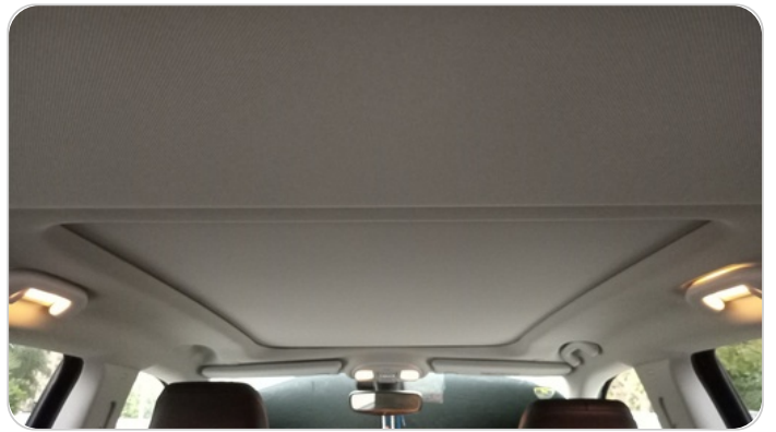
CAR ROOF MAT