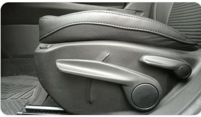
DRIVER SEAT SWITCHES