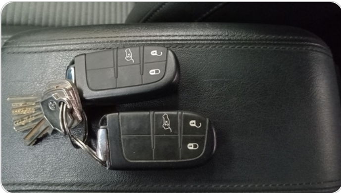
الريموت /المفتاح الاضافي : يعمل بكفاءة