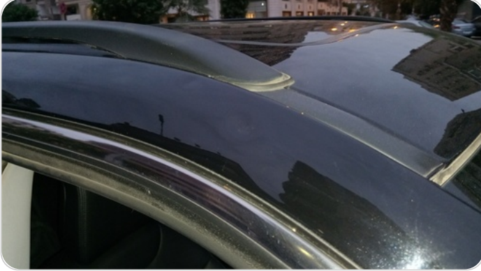
قائم خارجي أمامي يمين : فبريكة (خبطات)