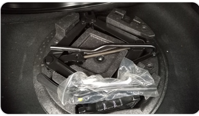
العدة وأدوات الأمان : متوفرة (بحالة جيدة)