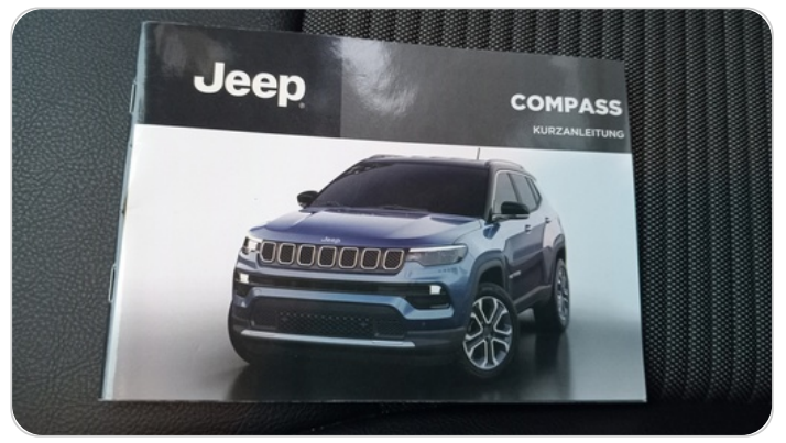
كتالوج السيارة : موجود