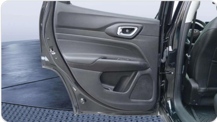
RR L DOOR