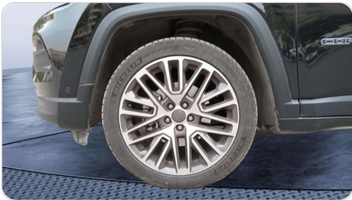
FR L TIRE