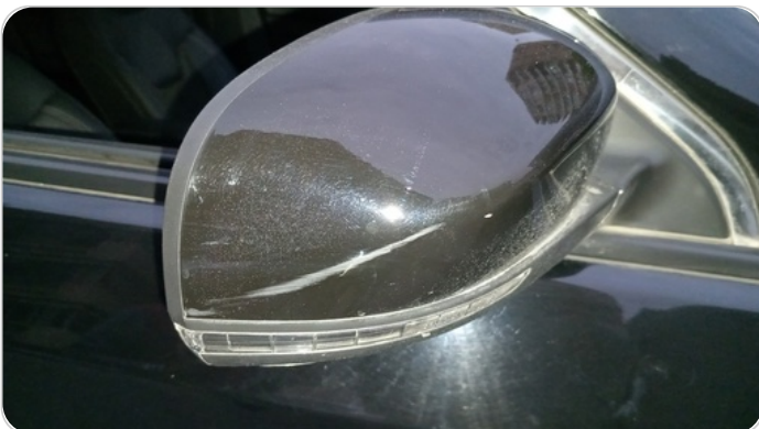
مراية الباب الأمامي يمين : فبريكة (خرابيش)