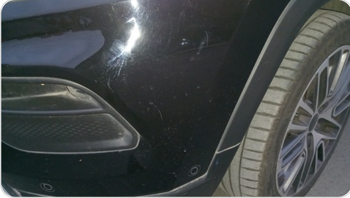
الاكصدام الأمامي : فبريكة (خرابيش)