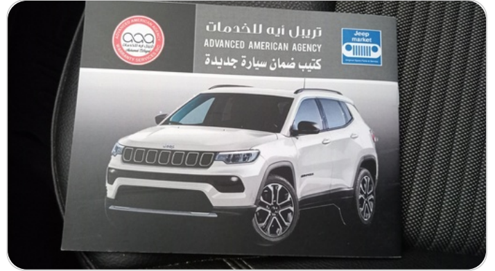
كتيب الضمان : موجود