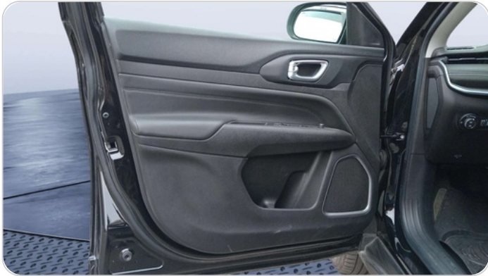
FR L DOOR