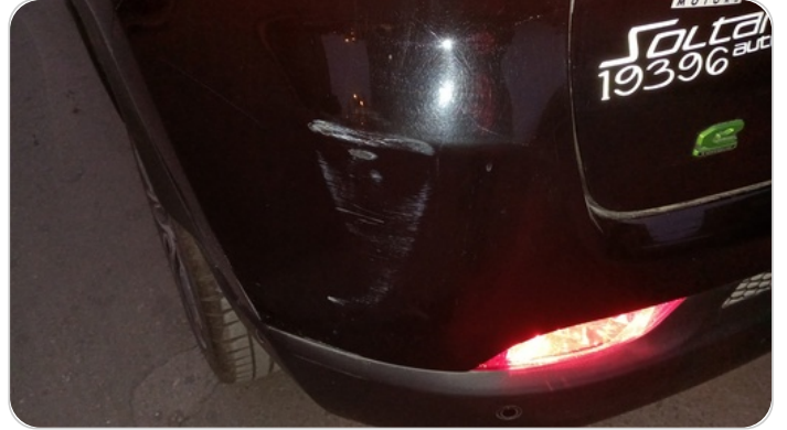
الاكصدام الخلفي : فبريكة (خرابيش)