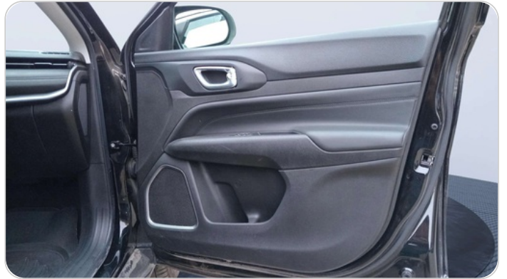
FR R DOOR