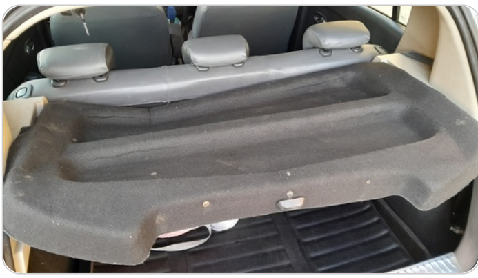
رف الشنطه الخلفي : تلف