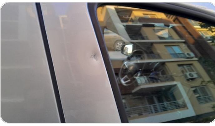
الباب الأمامي يمين : فبريكة (خرابيش)