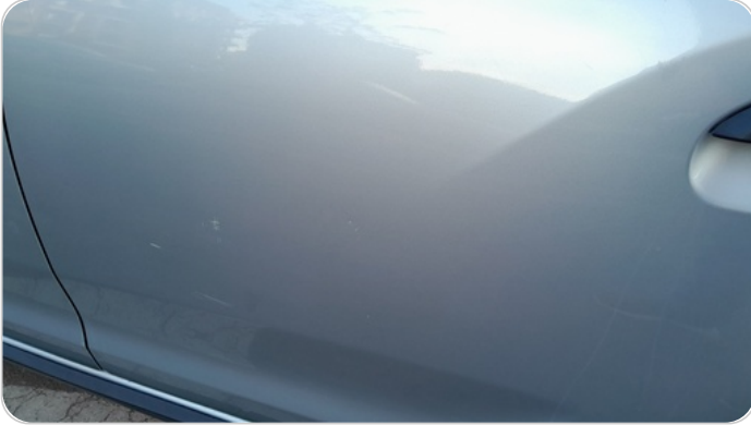
الباب الخلفي شمال : فبريكة (خرابيش)