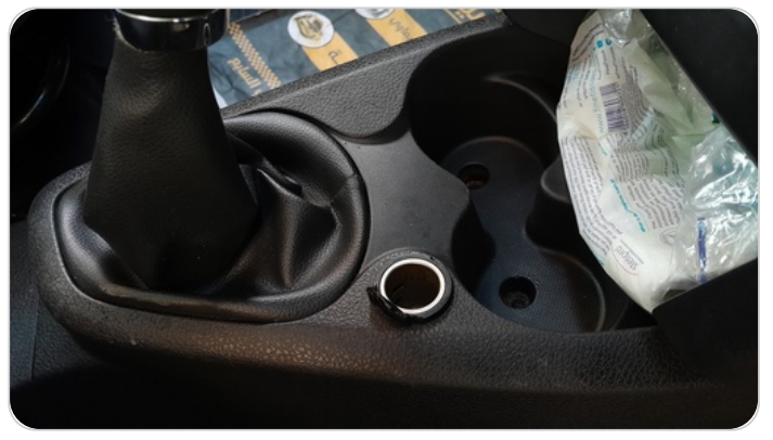
الكونسول الوسط : قطع / كسر / شرخ / تلف