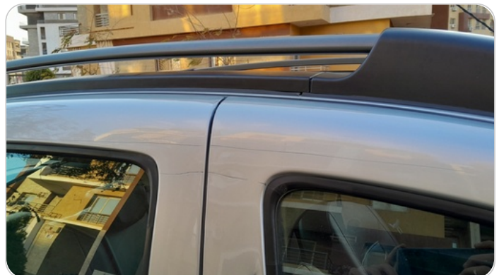
قائم خارجي أمامي يمين : فبريكة (خرابيش)