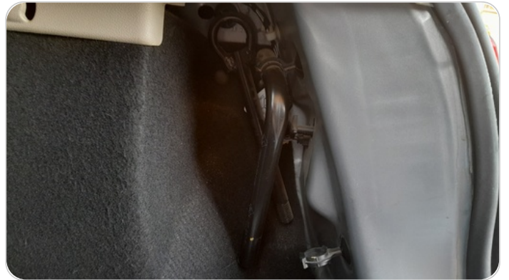
العدة و ادوات الامان : متوفرة (بحالة جيدة)