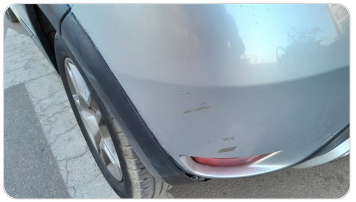
فيير داير رفر ف خلفي شمال : كسر