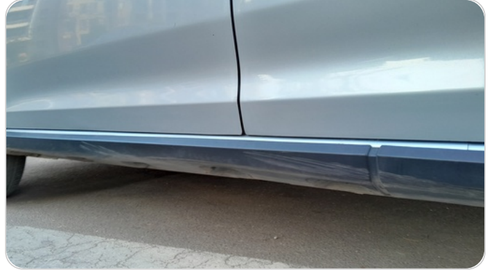
العتب السفلي شمال : فبريكة (خرابيش)