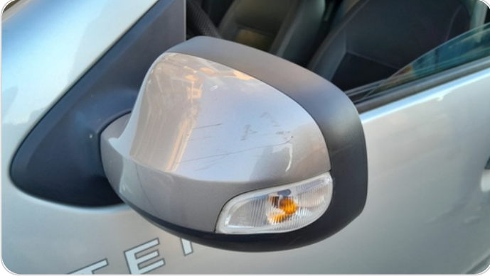
مراية الباب الأمامي شمال : فبريكة (خرابيش)