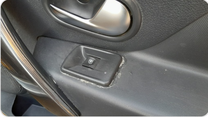
فرش الباب الأمامي يمين : قطع / كسر / شرخ / تلف