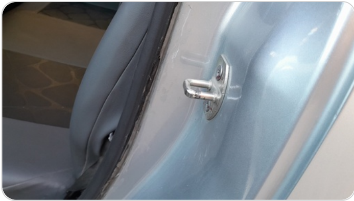
كاوتش باب : ماده لاصقه