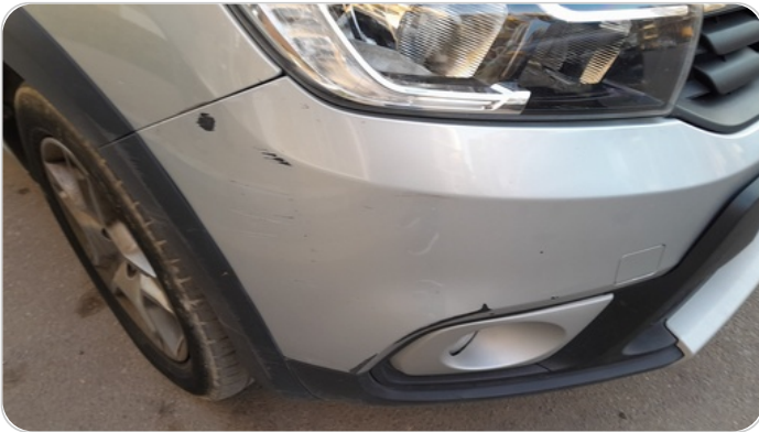
الاكصدام الامامي : فبريكة (خرابيش)