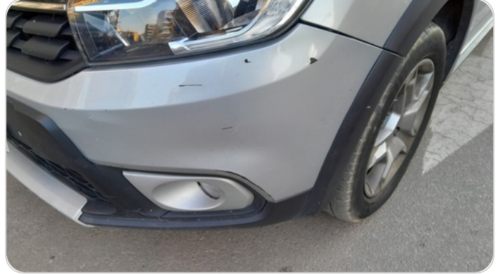
الاكصدام الأمامي : فبريكة (خرابيش)